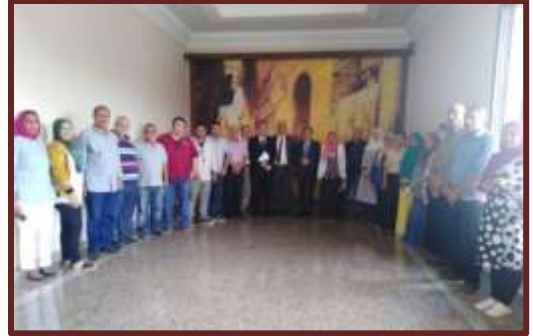
دورة "تنمية القدرات لشغل وظيفة مفتش رى"