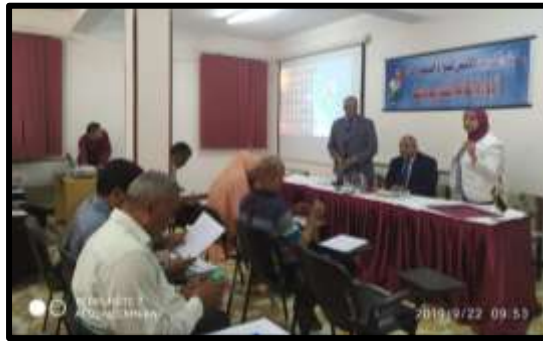
دورة " أصول ومهارات التحقيق الادارى "