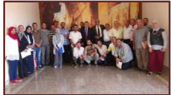
ورشة بعنوان "تنمية المهارات الشخصية للحرفيين والعمال"