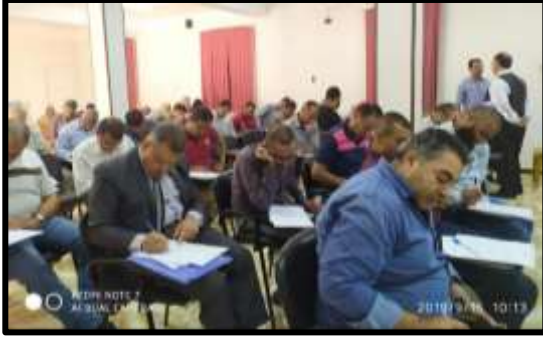
دورة " إعداد المدربين TOT فى مجال الشؤون التعاقدية"

تم تنفيذ عدد (5) نشاط تدريبي لعدد (125) متدرب.