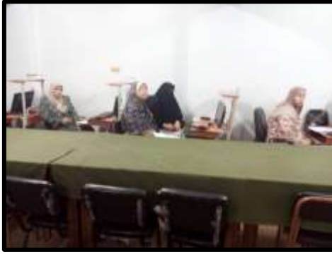
دورة "MS- Word"