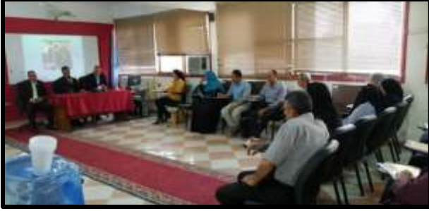
دورة " قانون الخدمة المدنية ٨١ "

○ تم تنفيذ عدد (4) نشاط تدريبي لعدد (77) متدرب.