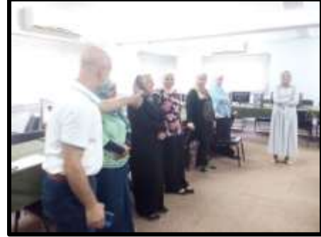
دورة "مهارات الاتصال والتفاوض الفعال وفض النزاع"