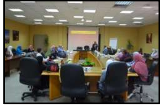
ورشة عمل "لنقاط الإتصال ومسئولي التدريب بالوزارة"