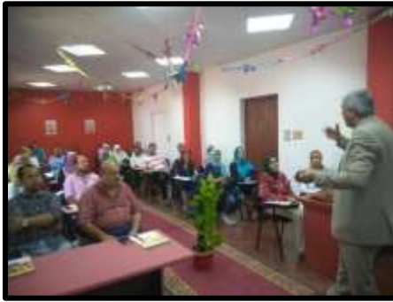
ندوة "مهارات القيادة والإدارة"

○ تم تنفيذ عدد (2) نشاط تدريبي لعدد (62) متدرب.