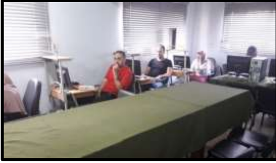
دورة "Auto Cad " المستوى الأول"

○ تم تنفيذ عدد (5) نشاط تدريبي لعدد (88) متدرب.