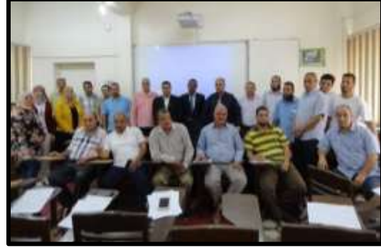
دورة "الأساليب الحديثة لإدارة الموارد البشرية"