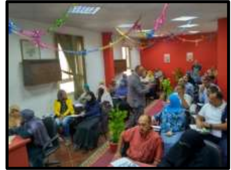
دورة " الشؤون المالية والإدارية "