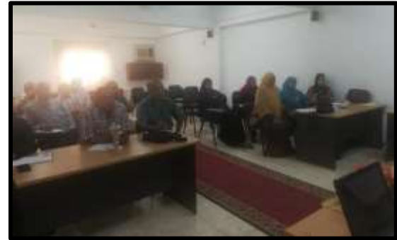
دورة "التأمينات الإجتماعية والمعاشات"