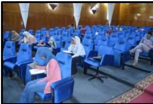
إختبار تحديد مستوى " Pre IELTS "