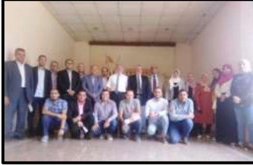
ورشة عمل "المشاركات الخارجية"

■ تم تنفيذ عدد (8) نشاط تدريبي لعدد (199) متدرب.