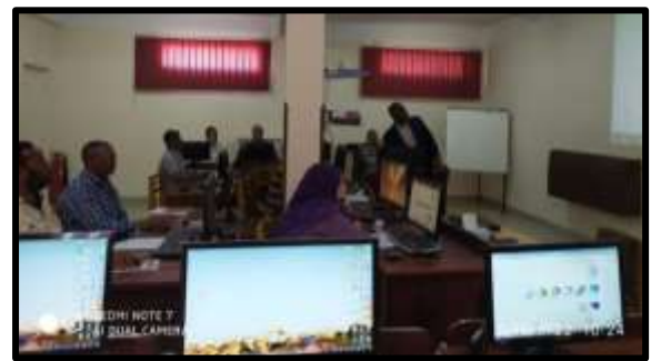
دورة " Windows "