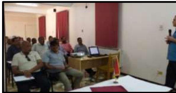
دورة " إدارة المخازن والمشتريات والرقابة على المخزون السلعى "