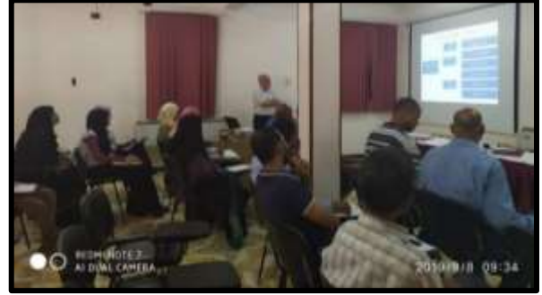
دورة "تشغيل وصياناه محطات الطلمبات"