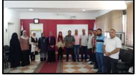
دورة "لغه انجليزية محادثه مستوى اول"