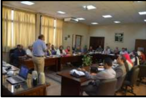
دورة "إعداد القيادات الإدارية"