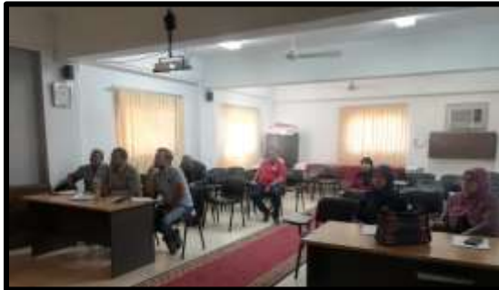
دورة "TOT الشؤون التعاقدية"

○ تم تنفيذ عدد (3) نشاط تدريبي لعدد (59) متدرب.